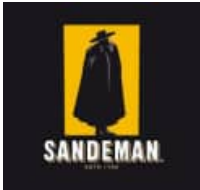
secco medium cream